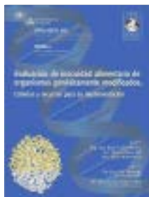
Evaluación de inocuidad alimentaria de OGMs. Criterios y recursos para su implementación