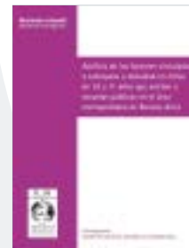
Análisis de los factores vinculados a sobrepeso y obesidad en niños de 10 y 11 años...