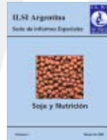
Soja y Nutrición Informe Especial