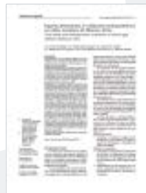
Ingesta Alimentaria y Evaluación Antropométrica en niños escolares de Buenos Aires