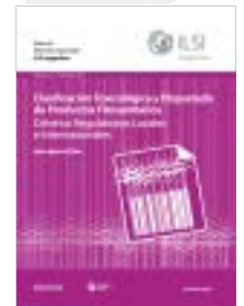
Clasificación toxicológica y etiquetado de productos fitosanitarios