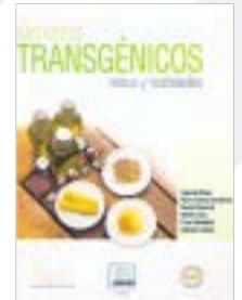
Alimentos Transgénicos: Mitos y realidades